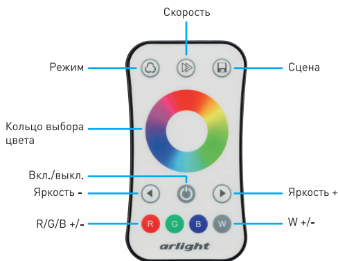
Рисунок 2. Назначение кнопок на пульте управления