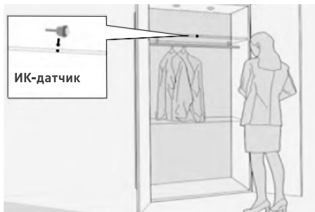
Вариант установки SR2-Door