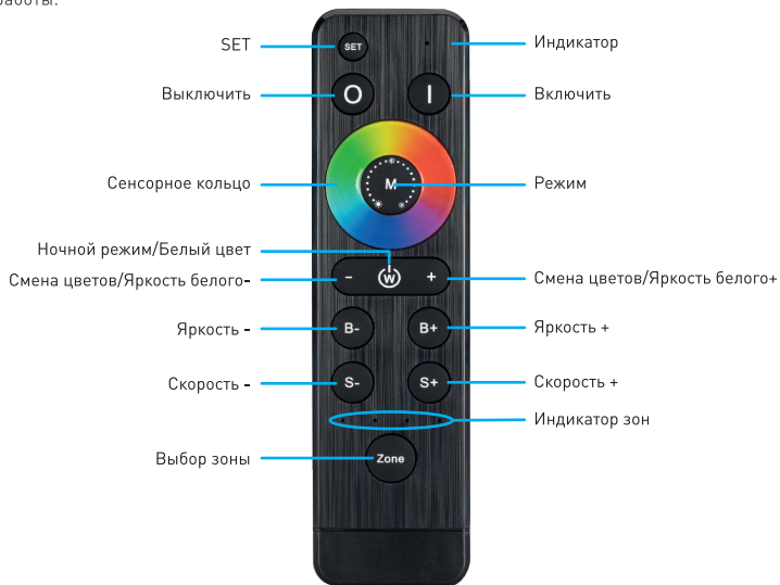
Рисунок 1. Назначение кнопок пульта управления ARL-STICK-DIM