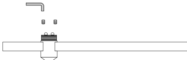
Рис. 2. Установка держателя на трек