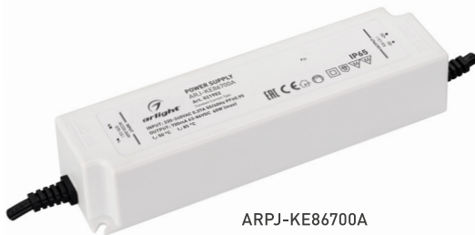
ARPJ-KE86700A ARPJ-KE571050A ARPJ-KE421400A