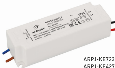
ARPJ-KE72350A ARPJ-KE42700A ARPJ-KE60700A ARPJ-KE401050A