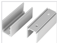
Держатель Арт. 021551 ARL-U15-Clip [26x15mm]