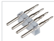
Силовой коннектор Арт. 022303 ARL-4pin RGB