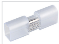
Прямой соединитель Арт. 022304 ARL-CF5060-RGB