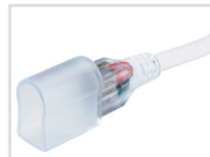
Коннектор с проводом Арт. 022061 ARL-U15-Wire-RGB-24V