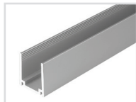
Профиль Арт. 026650 ARL-U17 [26x17mm]